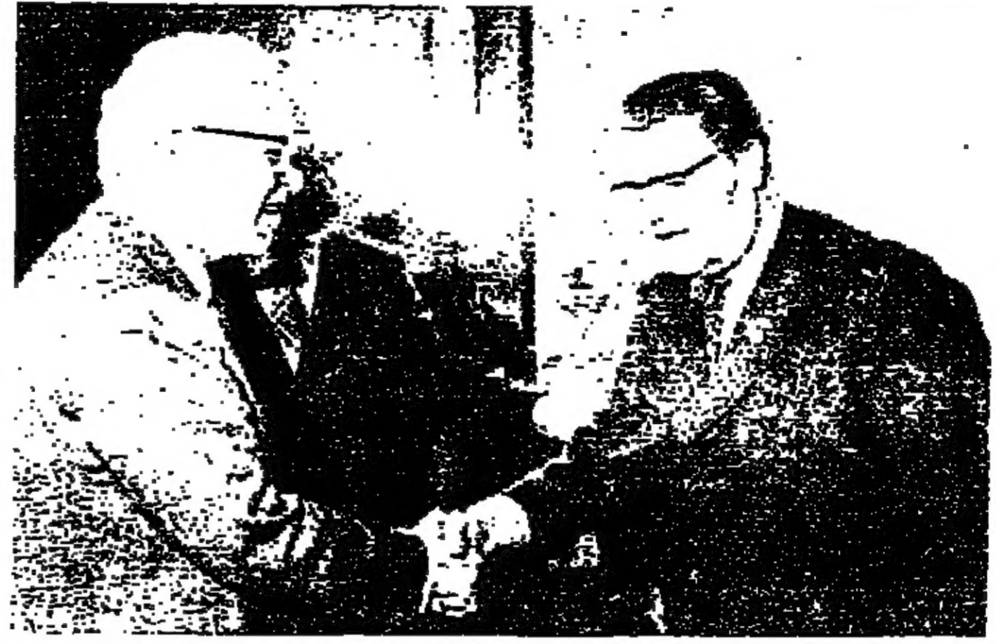
استقبل الرئيس سليمان مرنهية قبل ظهر امس، الوفد البرلماني الاوروبي الذي يزور لبنان حاليا، بحضور رئيس الحكومة السيد رشيد الصالح.